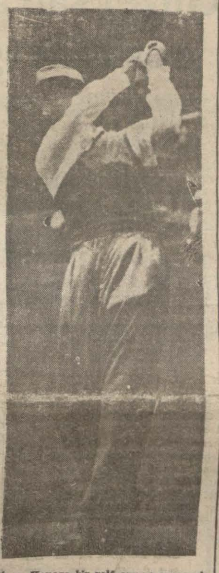
Frans Konoye bir golf oyununda esnasında Londra radyosu Uzaksark vaziyeti - nin vahametini muhafaza etmekte ol - duğunu söylemektedir. Avustralya baş - [Devamı 5 inci sayfada.]