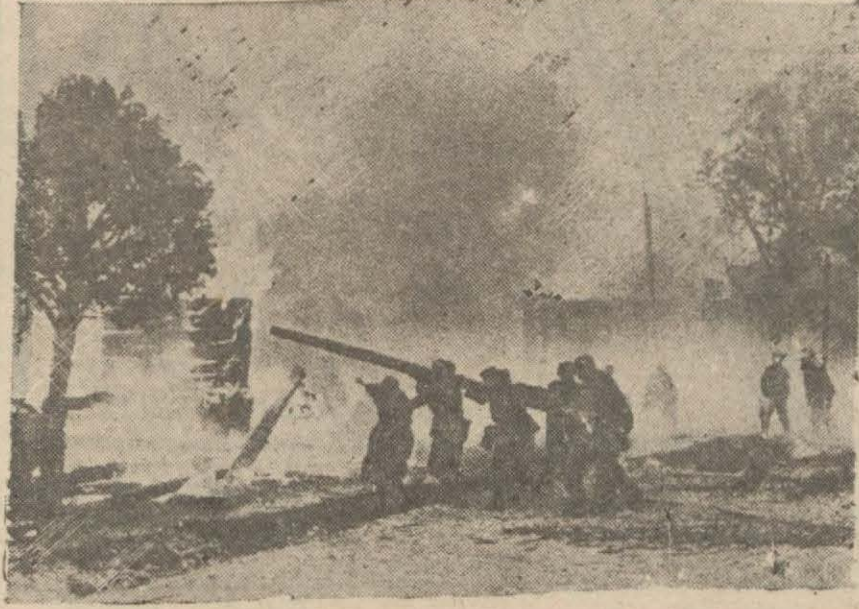
Yanan bir Sovyet şehrinde yangınları söndürmeye uğraşan Alman kuvvetleri