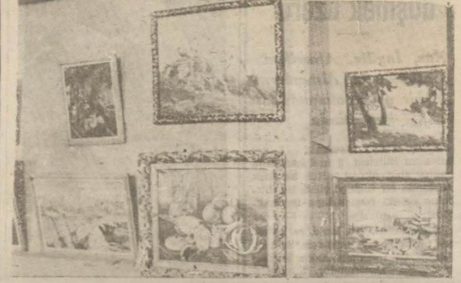
Sergiden bir kâse

Güzel san'atlar birliği resim sergisi açıldı